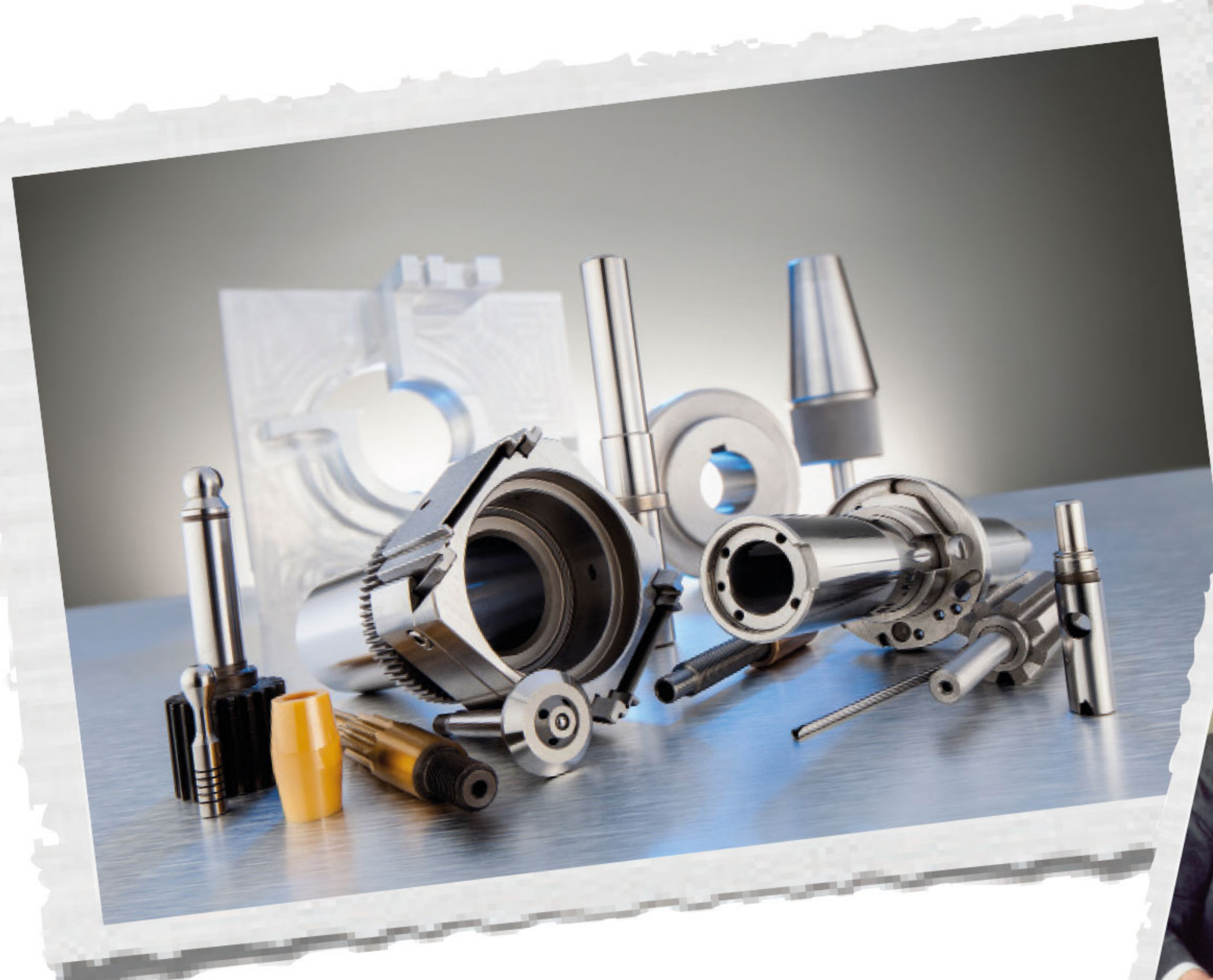
LILLICH Präzisionsteile für den Maschinen- und Werkzeugbau, die Automobilindustrie, Elektroindustrie, Medizintechnik und Automatisierungstechnik.

Vom Schleifpapst zum führenden Zulieferer von Präzisionstechnologie, Komponenten und Dienstleistungen in Wachstumsmärkten