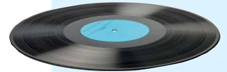
Die gute, alte Vinyl-Schallplatte. Legendäres Symbol der 60iger Jahre – da ging es rund!

Aus dem 2-Mann Garagenbetrieb erwuchs schnell ein Fertigungsunternehmen, dessen erste Expansion 1971 an den heutigen Standort „An die Mauer 9“ in Schwann führte. Der Weg vom „Schleifpapst“ zum „Hersteller hochwertiger Präzisionsteile“ nahm 1975 mit der Erweiterung der Fertigung auf Komplettteilbau in der 650 Quadratmeter großen Produktionshalle seinen Lauf.