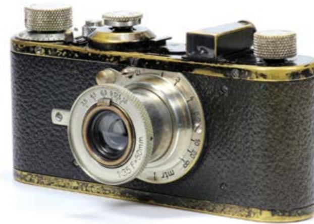
50 Jahre LILLICH – für uns ein Moment, um inne zu halten

Das Ererbe wurde gut über die Jahrzehnte gebracht. Rund 45 qualifizierte und engagierte Mitarbeiter arbeiten heute bei LILLICH. Die Produktionsfläche ist mit dem vorerst letzten Anbau im Jahr 2007 auf 2.450 Quadratmeter angewachsen. Mit dem Bau eines Materialturms im Jahr 2012 für Rohmaterial und Halbzeug wurde in eine kostenoptimal gesteuerte Produktion investiert. Frei nach dem Motto: „Gut geplant ist halb gefertigt“! Die enge Synchronisation der Kundenbedarfe mit den Fertigungskapazitäten, die Maschinenkapazität und die Personaleinsatzplanung – sowie die punktgenaue Verfügbarkeit von Halbzeugen und Rohmaterialien zum Startzeitpunkt des Produktionsauftrages sind wichtige Planungsfaktoren.