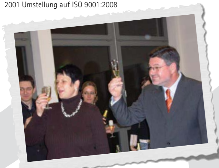
1996 Auf das neue Jahrtausend! Große Ziele liegen vor uns.

Mehrfach gerüstet für die Zukunftsmärkte unserer Kunden.