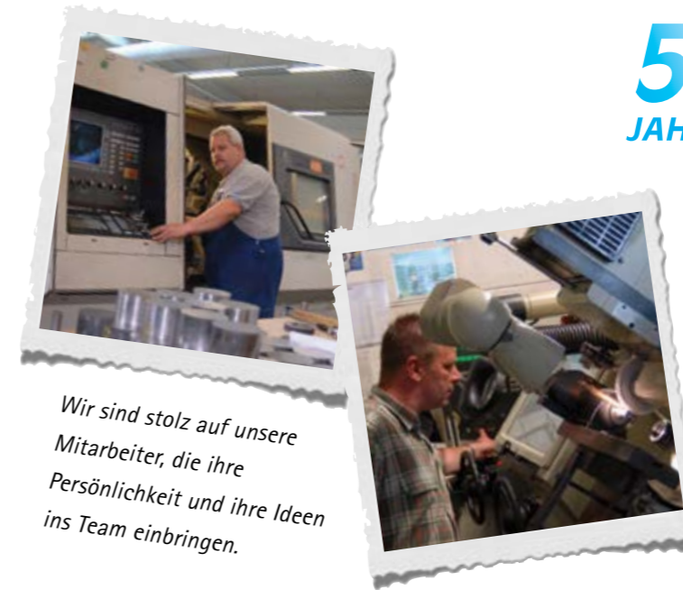
Wir sind stolz auf unsere Mitarbeiter, die ihre Persönlichkeit und ihre Ideen ins Team einbringen.

Grundlegende Navigationskenntnisse sind beim ständigen Streben nach Verbesserung unerlässlich