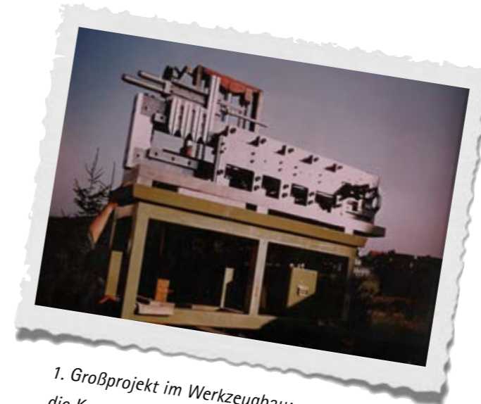
1. Großprojekt im Werkzeugbau: die Komplettfertigung einer Räummaschine.

Die Voraussetzungen für eine großartige Zukunft konnten nicht besser sein. Die Entwicklung in der manuellen Fertigung ging stetig voran und führte zu einer deutlichen Ausweitung des Leistungsspektrums als Lohnfertigungsunternehmen. Die Ansprüche von LILLICH sind hoch, aber ernsthaft begründet, schließlich soll sich die Erfolgsgeschichte des Familienunternehmens als einer der führenden baden-württembergischen Präzisionsschleifereien fortsetzen.