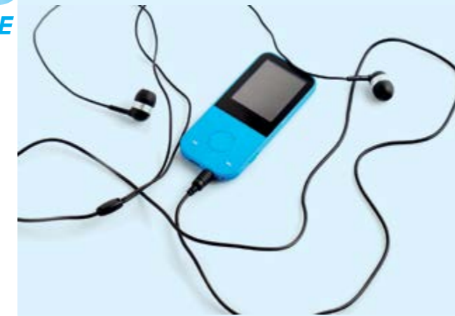
Immer das Ohr am Markt! Auch um Chancen, für die langfristige Wachstumsentwicklung aufzuspüren.

Bei LILLICH findet Zukunft statt: Stehen bei der Präzisions-Technologie für die High-Tech-Produkte von morgen die Optimierung der Rüstzeiten und der Durchläufe in Produktion und Logistik im Vordergrund, soll durch eine komplexere Fertigung im Sinne der verlängerten Werkbank und einer Just-in-Time-Produktion das Unternehmen in den nächsten Jahren profitabel wachsen. Das persönliche Engagement ist stark, das Verantwortungsgefühl hoch.