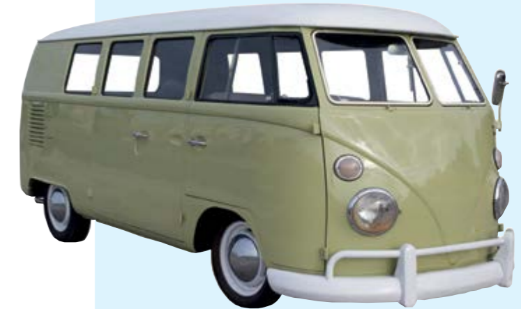
Nach Wirtschaftswunder und Flower-Power – eine weitgehend automobilisierte Gesellschaft entwickelt sich.

1980 wird aus der Willy Lillich KG die Willy Lillich GmbH. Und mit Aufnahme der CNC-gesteuerten Produktion im Jahr 1985 beginnt eine neue Fertigungs-Ära. LILLICH dreht, fräst und schleift – Einzelteile und kleine Serien, montiert Komponenten und Baugruppen. Man tauscht sich mit Kunden rege aus, philosophiert über technische Raffinessen, baut Muster und arbeitet bei Speziallösungen eng zusammen. Doch die Anschaffung neuer Maschinen ist das eine. Mindestens genauso wichtig ist es, Abläufe klug zu strukturieren und die Mitarbeiter für die Veränderungsprozesse zu begeistern. Denn nur mit ihrem Antrieb läuft die Technik!