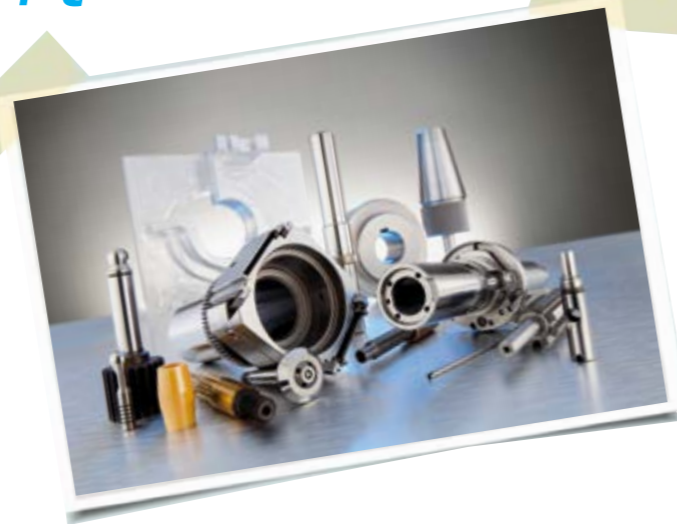
Vom Schleifpapst zum führenden Zulieferer von Präzisionstechnologie, Komponenten und Dienstleistungen in Wachstumsmärkten

Auch in Sachen Kunden- und Anwendungsbedarf schauen wir weiterhin ganz genau hin. Die Präzisionstechnologie in immer neuen Dimensionen ist für uns dabei die Kerntechnologie – und zwar quer über alle Fertigungsbereiche von LILLICH hinweg. Wir nutzen die Synergieeffekte zwischen den Fertigungsbereichen Drehen, Fräsen, Schleifen, der Baugruppenfertigung und Messeinrichtungen. So erhöhen wir unseren USP (Unique Selling Point). Denn die Kombination aus diesen Bereichen ist ein wesentlicher Wettbewerbsvorteil.