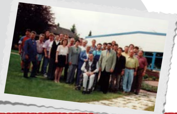
Auf Wachstum programmiert: 1973: 6 Mitarbeiter 1988: 16 Mitarbeiter 1996: 27 Mitarbeiter 2005: 35 Mitarbeiter

Modernes Qualitätsmanagement – reibungslose Implementierung der Kundenwünsche und Normanforderungen in die Praxis.